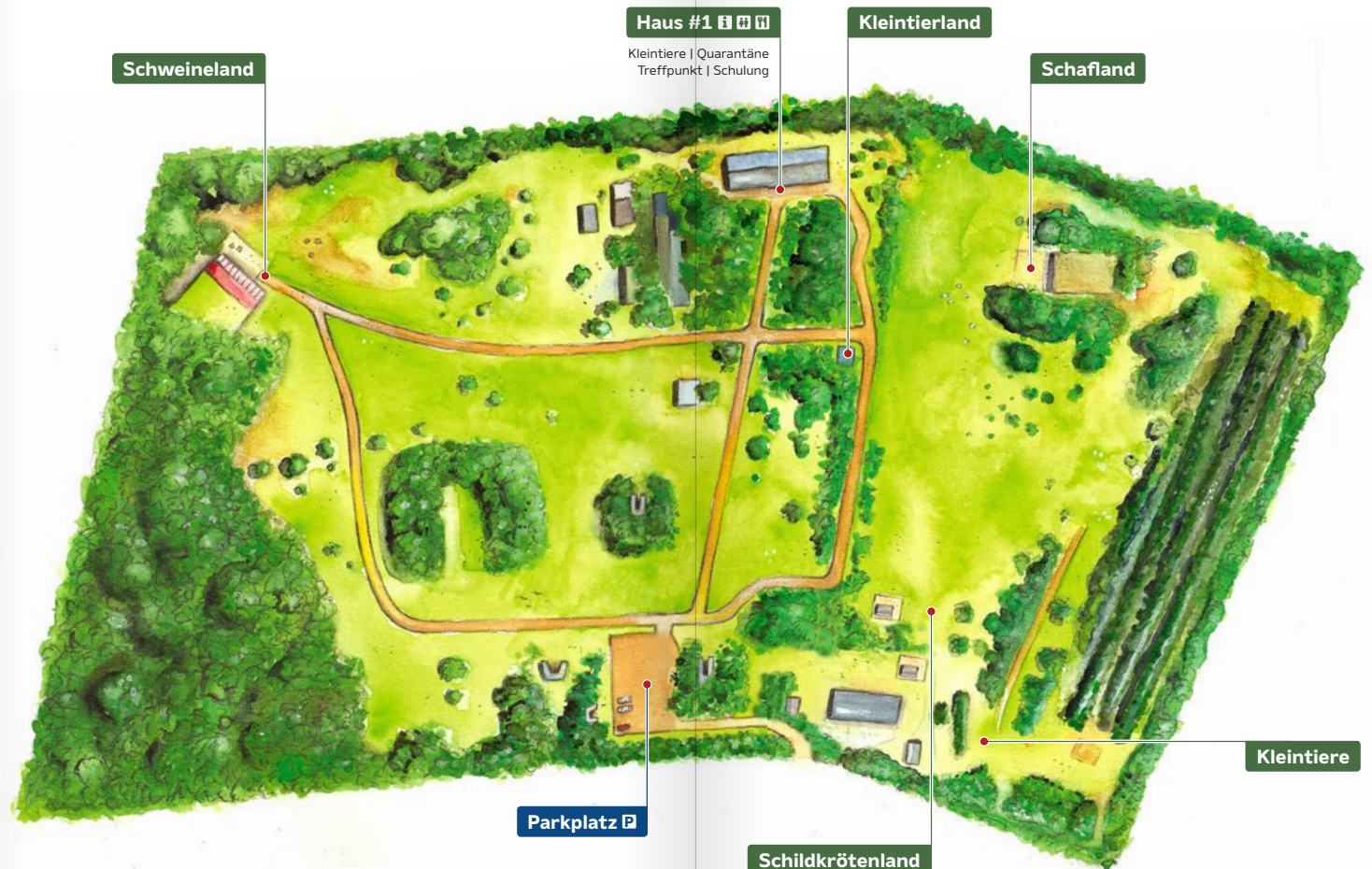
133000 Quadratmeter Frieden, Freiheit und Respekt für Tiere.